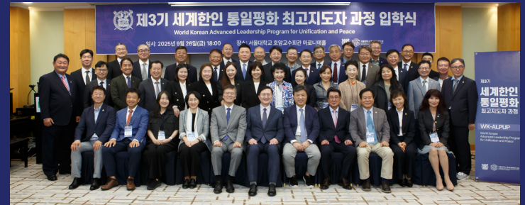
제3기 세계한인 통일평화 최고지도자 과정 입학식(2025년 9월 26일)