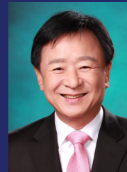
제1대 세계한인총연합회 회장 심상만

마침 서울대학교 통일평화연구원이 그동안 저희 동포재단이 해야 할 그러나 하지 못했던 일을 시작하는 것에 깊은 감사를 드리며 이 강좌가 차세대 세계한인 지도자들의 양성소가 되기를 진심으로 바랍니다.