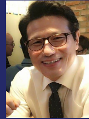
한국문화예술위원회 위원장 (前) 국회의원

그리고 선진 조국이 당면한 여러 도전과제들에 대한 전문적 식견을 제공하고 인적 네트워크를 형성하는 플랫폼이 될 것이기에 세계 한인 지도자 여러분들께 적극 추천합니다.