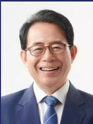
제 10대 재외동포재단 이사장 김성곤