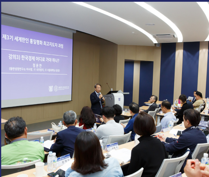
대면 집중 강좌