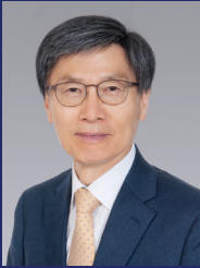
아산정책연구원 이사장 / 서울대 명예교수 (前) 외교통상부 장관