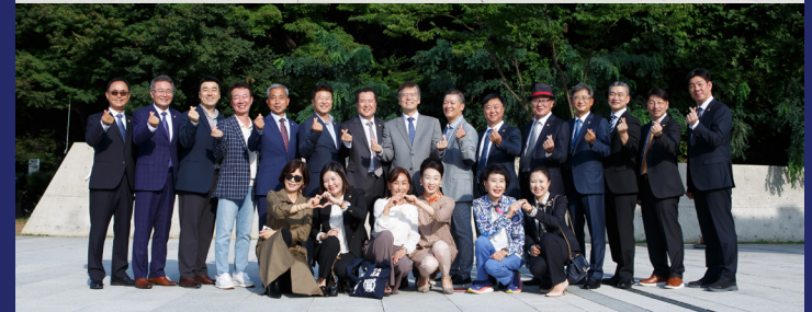
제3기 제1차 대면 집중강좌 중 서울대 정문 단체 사진