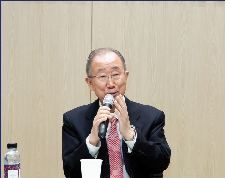
반기문 (前) 유엔 사무총장 강의